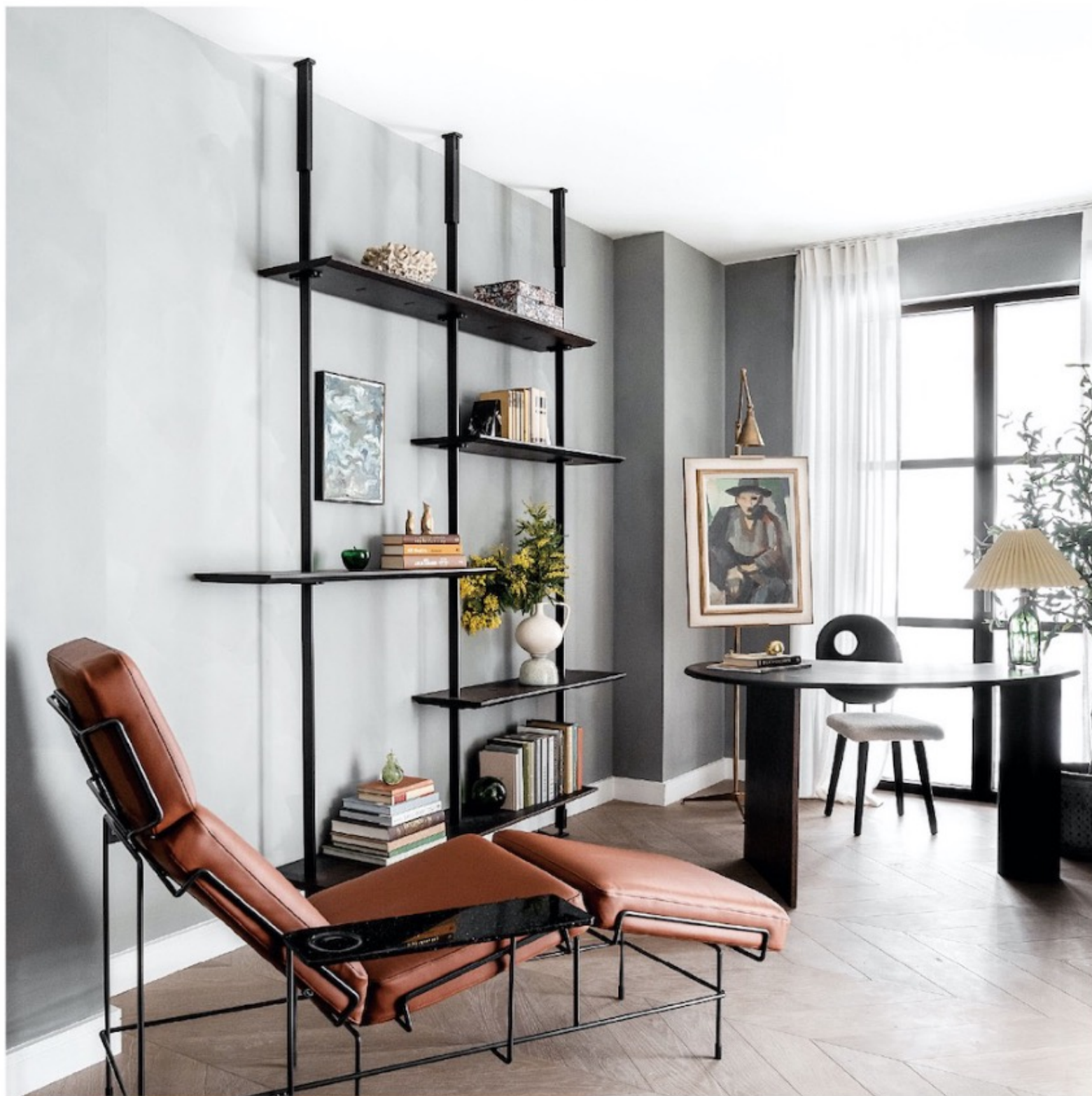
书房中有一张华丽的皮革躺椅，让人在工作得疲惫了的时候能够好好地充电。